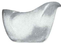
4A—8 OZ. CREAMER—1.75