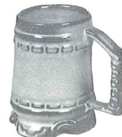
*M1—15 OZ. STEIN—1.80