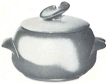
*4V—2 QT. BAKER/BEAN POT—4.50