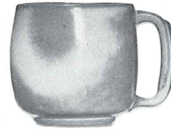
*4M—18 OZ. MUG—2.00