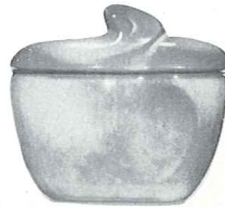
4B—SUGAR WITH LID—2.25