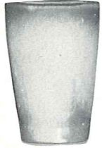
*5L—12 OZ. TUMBLER—1.50