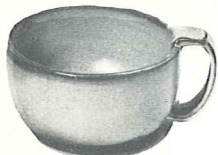
*4SC—11 OZ. SOUP CUP—1.50