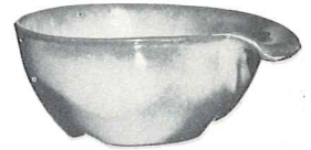
*4X—14 OZ. CEREAL—1.50