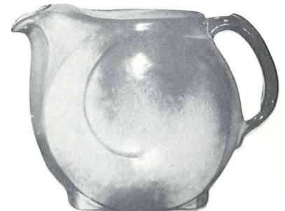
*4D—2 QT. PITCHER—4.50