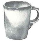
*5CC—5 OZ. TEACUP—1.25