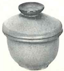
*BP—6 OZ. BEAN POT OR CUSTARD/WITH LID—1.75