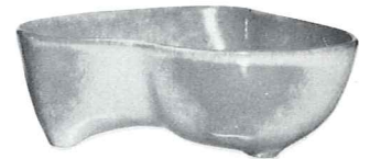
*4N—24 OZ. VEGETABLE—2.00