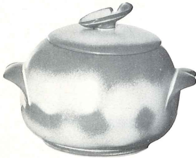
*4W—3 QT. BAKER/BEAN POT—6.00