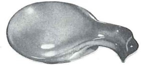
*4Y—6" SPOON HOLDER—1.25