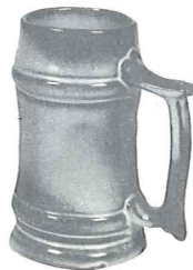
*M2—18 OZ. STEIN—2.00